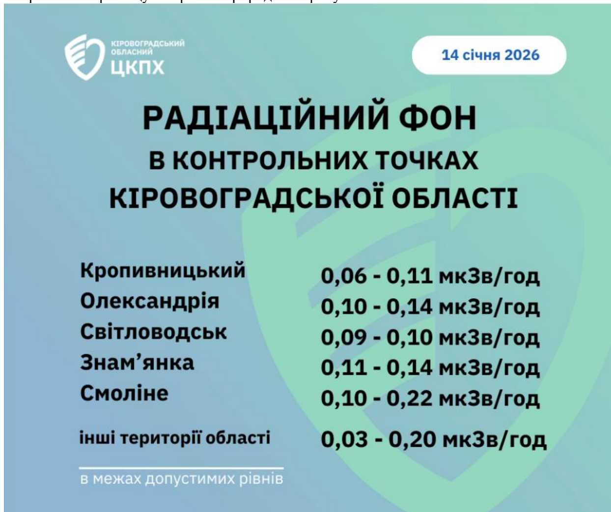
Рисунок 2.2 – Радіаційний фон в контрольних точках Кіровоградської області а 14.01.2026р.

Результати вимірювань природного радіаційного фону, що створюється випромінюванням природних радіонуклідів та космічного випромінювання, має стабільну динаміку. За результатами спостережень Кіровоградського обласного центру з гідрометеорології, значення радіаційного фону за останні роки не перевищують рівнів природного фону.